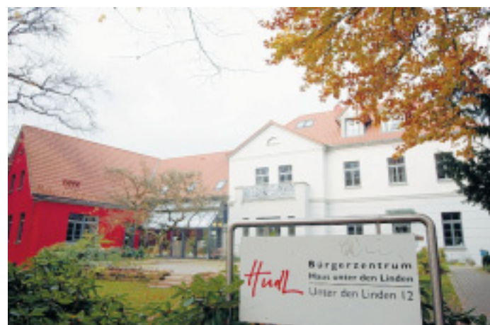
Im Bürgerzentrum finden vorerst keine Veranstaltungen statt: Betroffen ist der rechte Gebäudeteil, der rot gestrichene Anbau weist nach aktuellen Erkenntnissen keine Mängel auf.

Das gilt nicht für den betroffenen Gebäudeteil: Bis mindestens Ende des Jahres werden sich die Arbeiten hinziehen. „Diese Maßnahme ist für das HudL mehr als unangenehm“, sagte Wollbrink und seine zuständige Dezernentin ergänzte, dass derzeit von den zwölf HudL-Mitarbeitern ein Notplan erstellt und versucht werde, die Veranstaltungen in Ausweichquartiere zu verlegen.“ Bis dahin wurden jedoch sämtliche Veranstaltungen im Bürgerzentrum abgesagt.