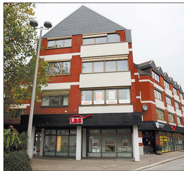
Vorübergehende Heimat des Bürgerzentrums: Das LBS-Haus an der Johannisstraße.