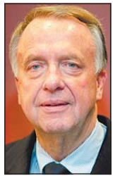
Bernd Neumann, MdB.

Herford (HK). Auf Einladung der MARTa Freunde & Förderer findet die Mitgliederversammlung des Bundesverbandes der Fördervereine Deutscher Museen für bildende Kunst am Montag, 24. November, im MARTa statt. Ehrengast und Referent ist der Kulturstatsminister Bernd Neumann, MdB. Bernd Neumann, MdB, Beauftragter der Bundesregierung für Kultur und Medien. Neumann hält ein Referat zum Thema »Im Bund mit der Kultur«.