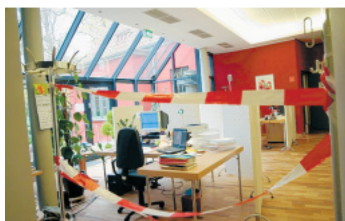
Abgesperrt: Hinter rot-weißem Flatterband haben HudL-Mitarbeiter ihr provisorisches Büro im Cafébereich eingerichtet.