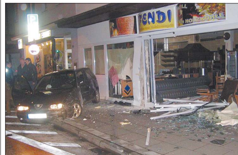
Im Schaufenster war Endstation: Zu einem schweren Unfall ist es gestern auf der Rennstraße gekommen.

straße befuhr. An der Verengung der Rennstraße auf einen Fahrstreifen wollte er vom rechten auf den linken Fahrstreifen wechseln. Da sich zu diesem Zeitpunkt noch ein 31-Jähriger mit seinem Pkw neben ihm befand, musste er beschleunigen oder bremsen. Beim Beschleunigen hat er wohl zu viel des Guten getan, meint die Polizei. Der Fiat wurde in das Geschäft geschleudert. Der 25-Jährige wurde verletzt. Den Schaden beziffert die Polizei auf 20 000 Euro.